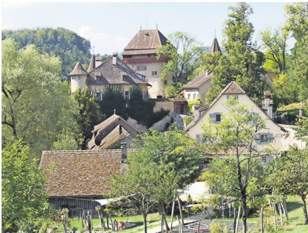
Hofgut Wildenstein mit Schloss