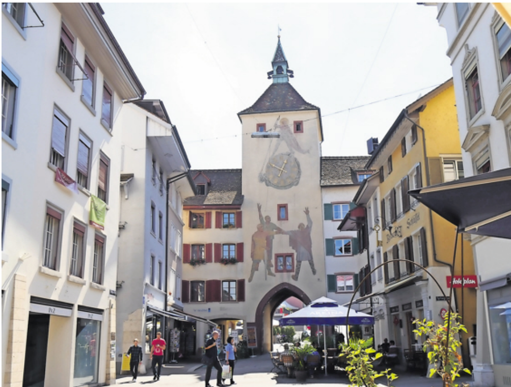
Das Liestaler Städtli ist bereit für die Genusswoche

Dass unser Kanton landschaftlich, kulturell und kulinarisch viel zu bieten hat, hat sich herumgesprochen. Einen grossen Anteil am zunehmenden Bekanntheitsgrad hat Baselland Tourismus. Dieser Verein ist die touristische Dachorganisation des Kantons und verantwortlich für die professionelle Gästebetreuung und die Weiterentwicklung von touristischen Angeboten.